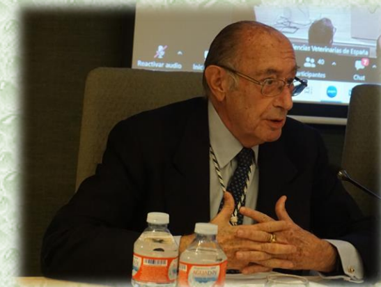
Dr. Jaime Lamo de Espinosa